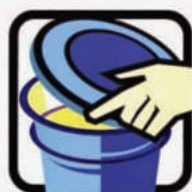
Mantenha tampados tonéis e barris d'água.