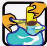
Coloque no lixo todo objeto não utilizado que possa acumular água.