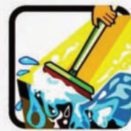
Não deixe água acumulada sobre a laje.

Vistorie semanalmente locais que possam acumular água das chuvas e elimine possíveis criadouros do mosquito.