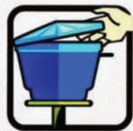
Mantenha a caixa d'água fechada.