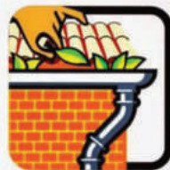
Mantenha as calhas limpas.