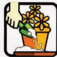
Encha de areia até a borda os pratos das plantas.