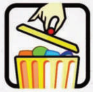
Coloque o lixo em sacos plásticos e mantenha a lixeira bem fechada.